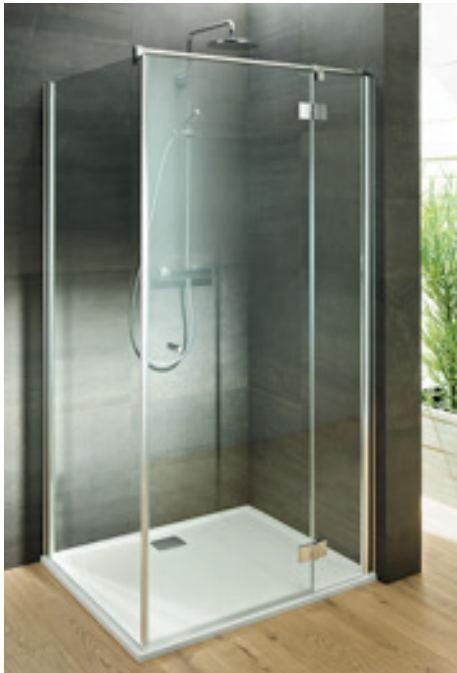
Glaswand Tür und Fixteil/EckEinstieg